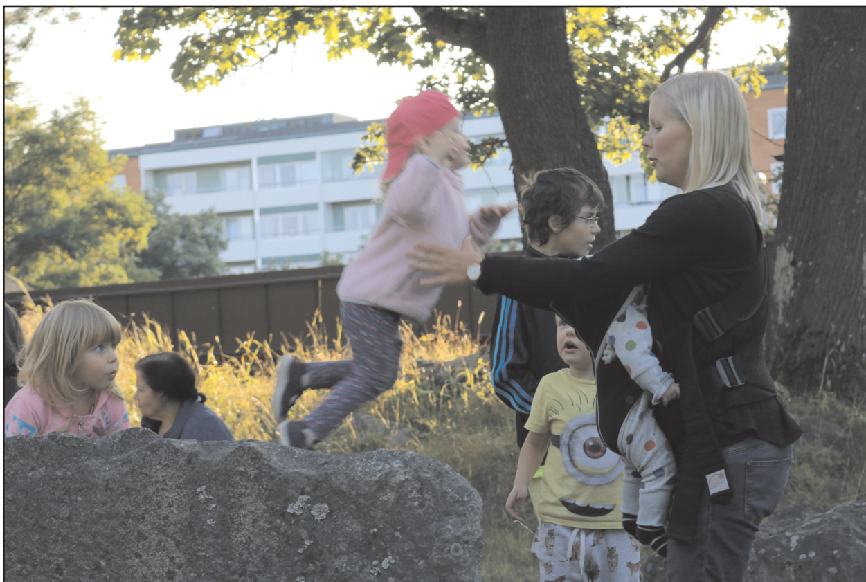
Barnen lever och växer med tro i frihet och gemenskap