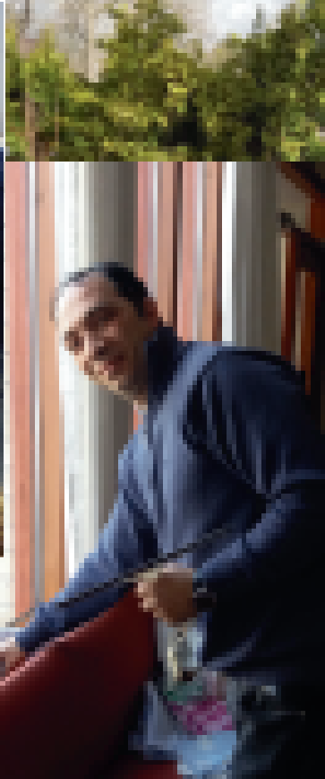
Bra hjälp med fönsterputsningen.