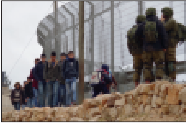
Barn passerar soldater

stod vi utanför skolan vid dagens början och slut som ett skydd för skolbarnen som passerade. Utanför skolan står ofta soldater och barn och lärare vittnar om trakasserier och även arresteringar av barn. Israel är den enda land i världen som systematiskt åtar mellan 500 – 700 barn om året, dessa barn är från 12 år. Många av dessa barn anklagas för stenkastning. Barn berättar om hur de dragits in i militärfordon och frågats ut på väg från skolan.