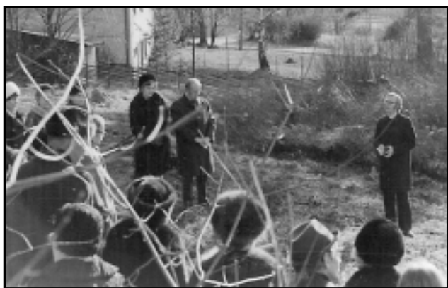
Andaktsstunden på tomten när det var beslutat att köpa den. OBS vi tog inget spadtåg utan bad om Guds Välsignelse över platsen