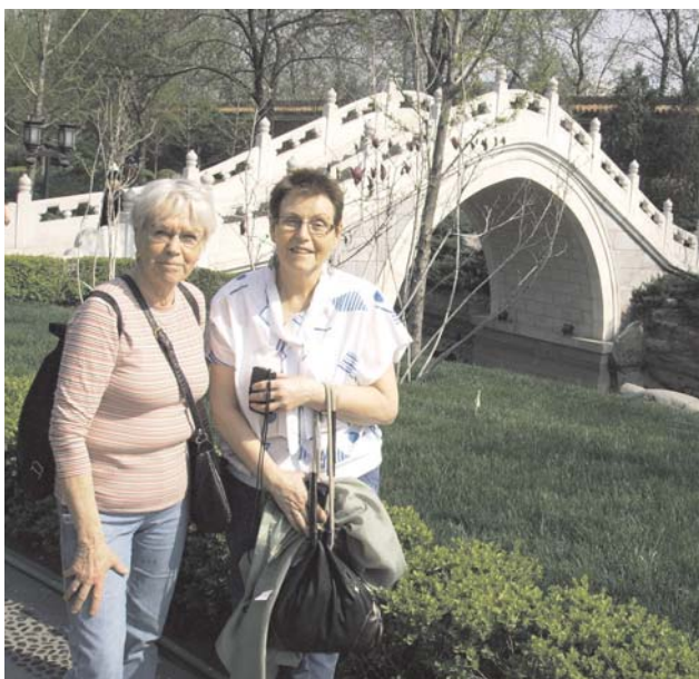
På väg in i den förbjudna staden