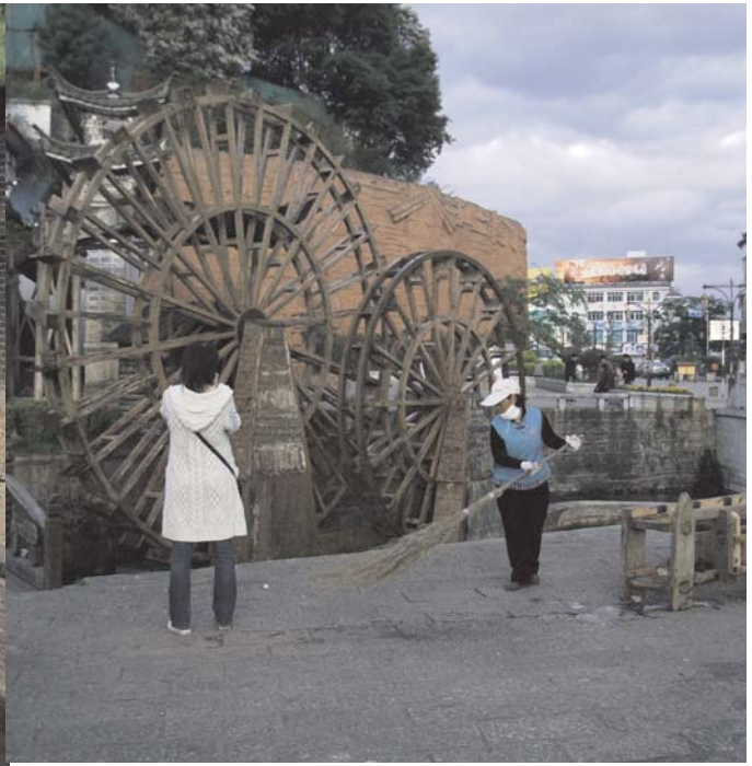
Liang - stad i nordvästra Kina. En gammal stad på 2 400 meters höjd