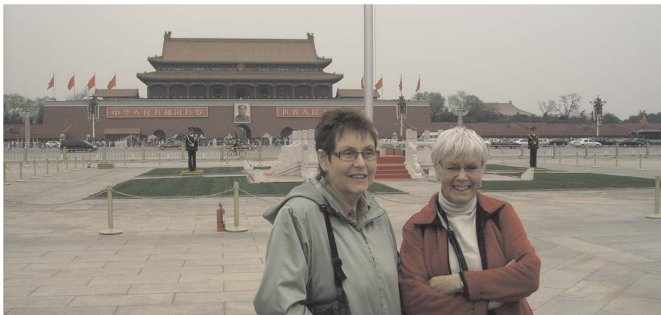
Ofattbart - vi är här. Himmelska fridens torg