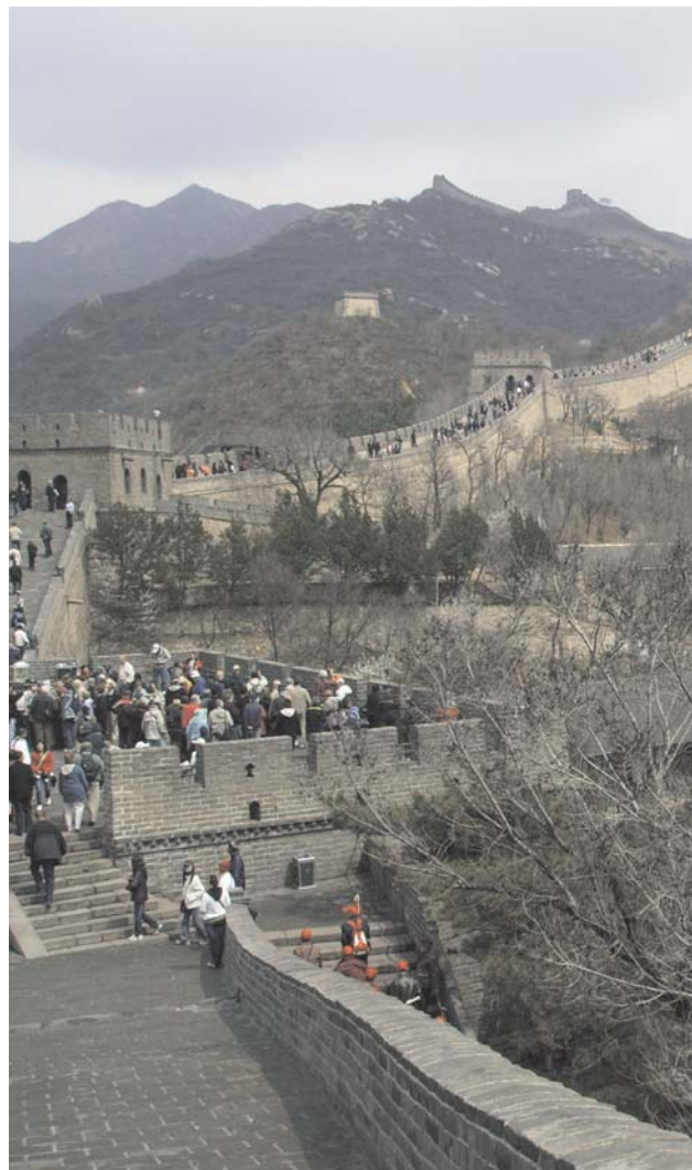
Brant stigning och många trappor. Den kinesiska muren.