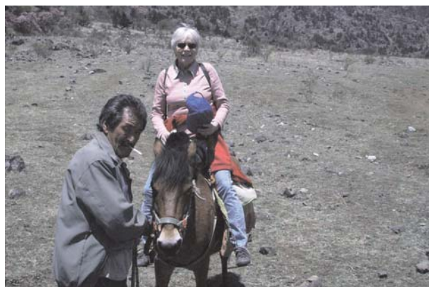
På hästrygg mot snöklädda toppar. Drakberget utanför Liang.