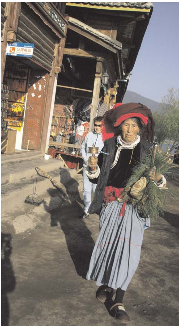
Kvinnor i sina vardagsdräkter vid Lugsjön.