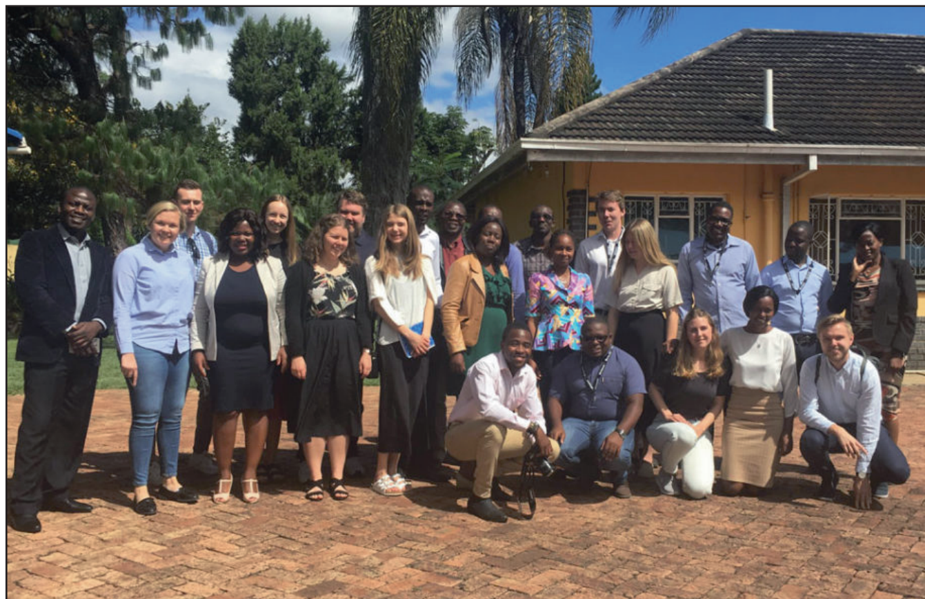
Aktivister från Sverige och Zimbabwe

Våra verkligheter är olika. I Sverige firar vi nästa år 100 år av fria val för män och kvinnor, och sett ur det perspektivet är höstens val bara ett i mängden. I