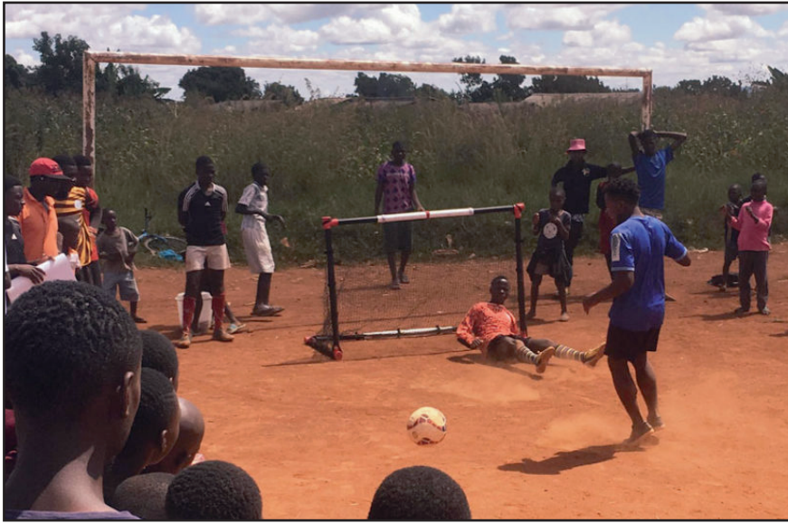
Organisationen Zimbabwe youth sports trust använder sport för att få unga att rösta: Slå en straff – om du registrerar dig för valet!

Zimbabwe förbereder sig människor för vad som kan bli det första fria valet någonsin i landets historia. Hos oss svenskar kan en känsla av att ta demokratin för given smyga sig på ibland. För de unga zimbabwier vi mötte fanns en rädsla för att inte våga hoppas för mycket på demokratin.