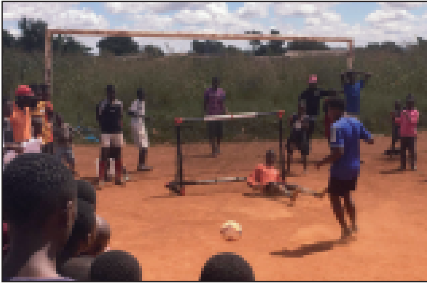
Organisationen Zimbabwe youth sports trust använder sport för att få unga att rösta: Slå en straff – om du registrerar dig för valet!

Zimbabwe förbereder sig människor för vad som kan bli det första fria valet någonsin i landets historia. Hos oss svenskar kan en känsla av att ta demokratin för given smyga sig på ibland. För de unga zimbabwier vi mötte fanns en rädsla för att inte våga hoppas för mycket på demokratin.