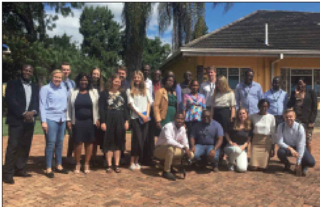
Aktivister från Sverige och Zimbabwe

Våra verkligheter är olika. I Sverige firar vi nästa år 100 år av fria val för män och kvinnor, och sett ur det perspektivet är höstens val bara ett i mängden. I