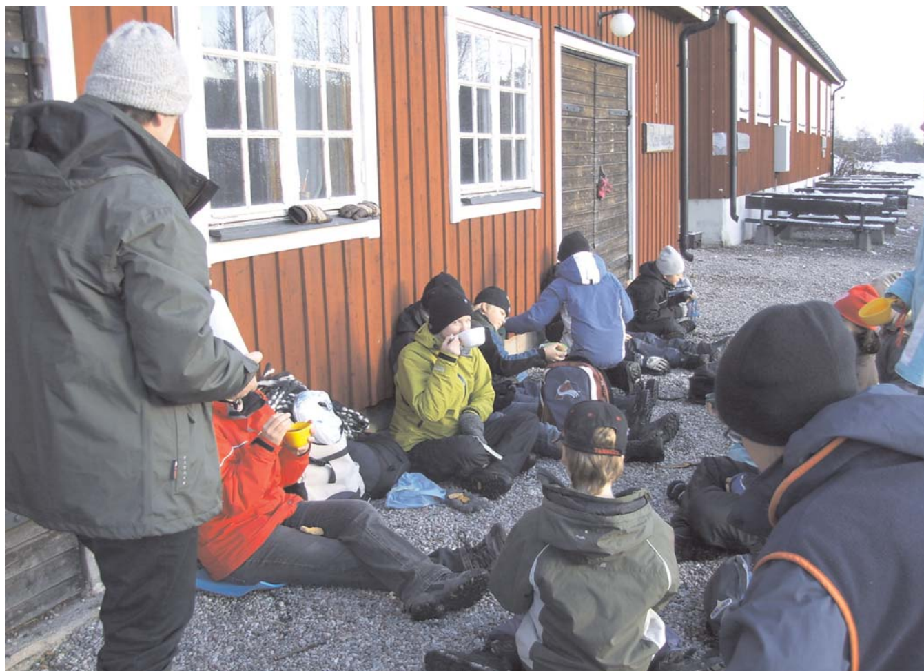
Blåbärssoppa i solen vid Väsby gård

Sedan vandrade vi vidare på Järvafältet, solen sken och snön var så vit på träden. När vi kom in på stigarna i skogen var det lite lerigt men inte bekymrade det oss. Med glatt humör tog vi oss fram med våra ryggsäckar. Skymningen kom smygande och klockan hade nästan blivit tre, när vi kom fram till Viiby. Vi tog bussen tillbaka till Norrviken och civilisationen. Ett pendeltåg senare och vi var åter på stationen i Väsby.